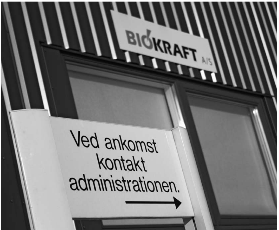
Biokrafts administrasjonsbygning Rønnevej 48, Aakirkeby.