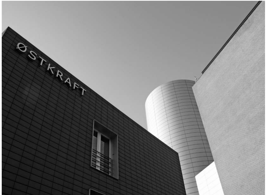
Østkrafts administrasjonsbygning Skansevej 2, Rønne.