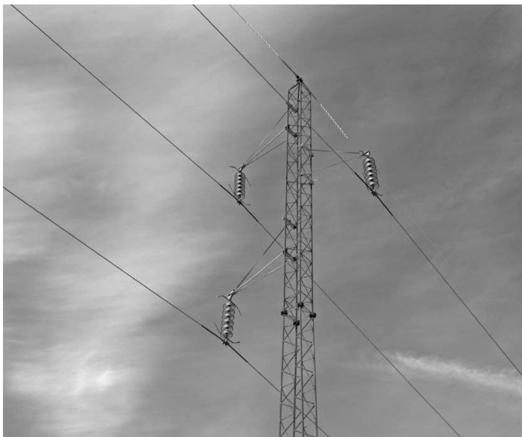
60 kV mast ved Snorrebakken, Rønne..