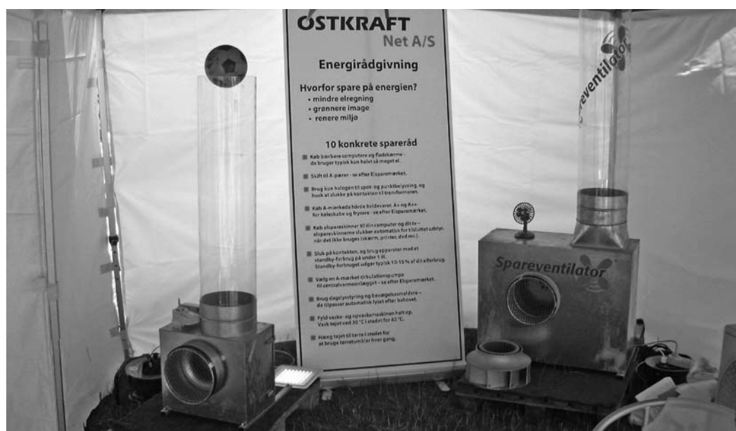
ØSTKRAFT Net A/S's stand på Dyrskuet i Almindingen.

De samlede energirådgivningsaktiviteter har bidraget til, at Østkraft har nået de energipolitiske mål, som fastsættes fra centralt hold. Derudover støtter de nævnte aktiviteter alle op om "Bornholms Energistrategi 2025", som Bornholms Regionskommune står bag.