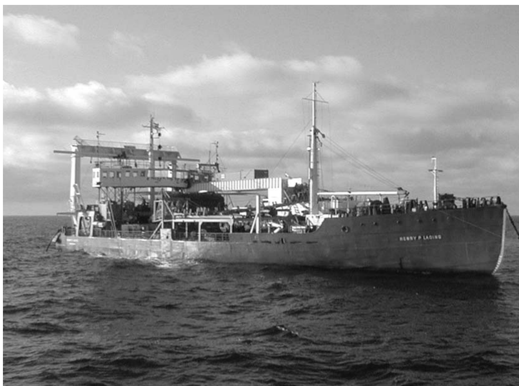
Kabeltransport- og udlægningsfartøjet H. P. Lading under arbejdet med reparation af søkablet mellem Bornholm og Sydsverige.

ØSTKRAFTs samlede medarbejderstab er fortsat på knap et hundrede medarbejdere. Behovet for kompetencer ændres løbende, og det er hidtil lykkedes at lade dette foregå som en organisk udvikling i takt med naturlig afgang. Endvidere vil målrettet oplæring til nye kompetencer foregå, eksempelvis gennemføres der for personalet som beskæftiger sig med optiske fibernetforbindelser målrettede uddannelsesforløb, således at ØSTKRAFT opbygger en solid kompetence på dette område. Ved indgangen til 2005 beskæftiger ØSTKRAFT-koncernen 97 medarbejdere og antallet forventes at være stabilt i 2005.