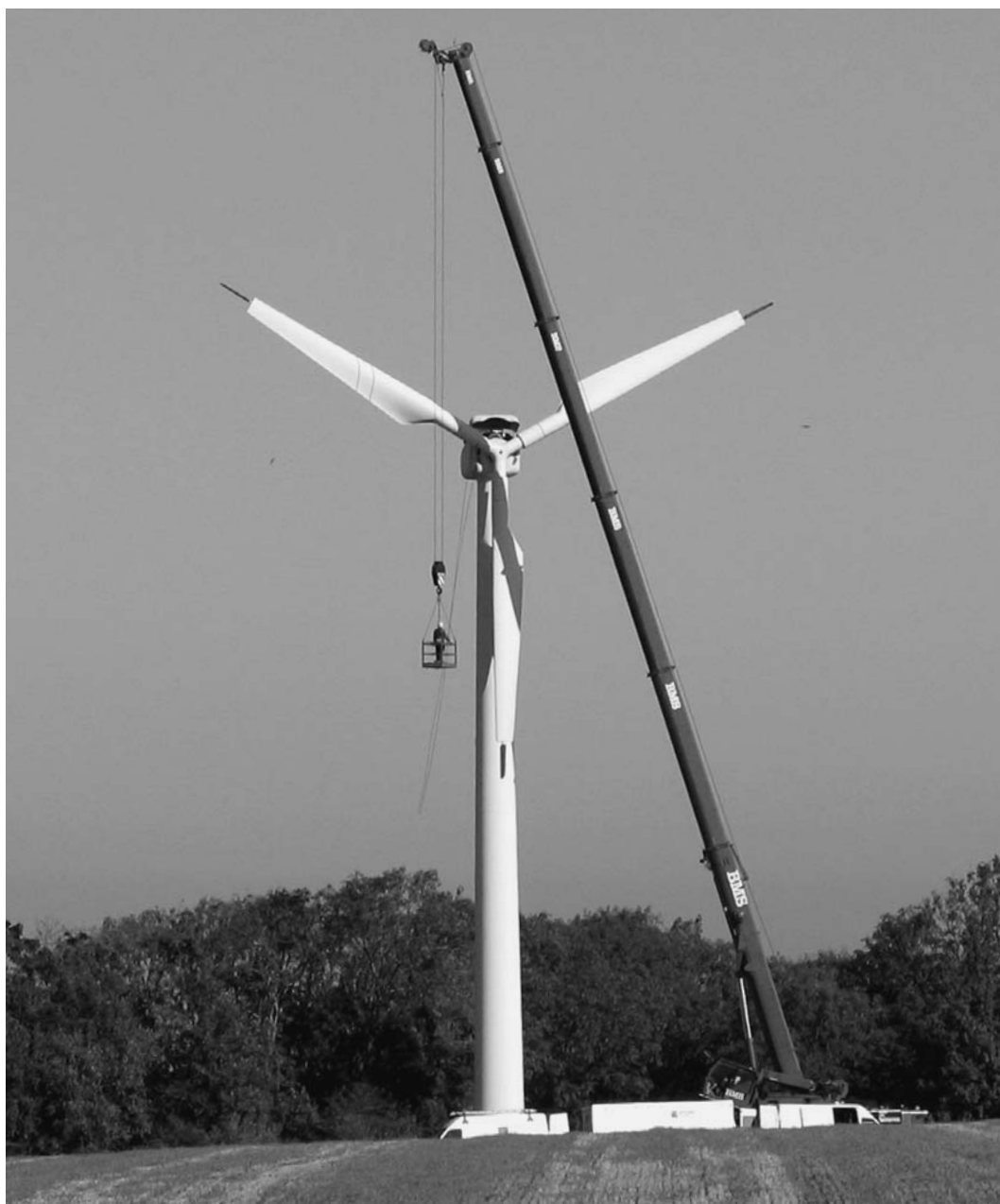
Nedtagning af vindmølle ved Bavnebanke nær Svaneke den 7. oktober 2005.

Udover de 6 nye vindmøller som opstilles i 2006, har Østkraft ønske om at opstille yderligere vindmøller. Desværre har det endnu ikke været muligt at finde en egnet placering til disse vindmøller.